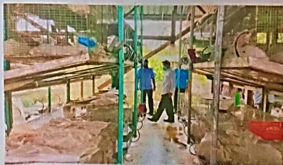
Tapak projek ternakan arnab pedaging di Kampung Lambor, Wakaf Bharu, Tumpat yang mampu menampung kapasiti sehingga 350 arnab.

"Penternak digalakkan menyertai kursus asas penternakan arnab bagi meningkatkan kemahiran dan merencanakan industri pemasaran daging arnab," katanya.