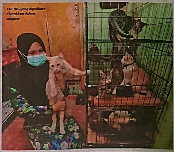
KUCING yang dipelihara diletakkan dalam sangkar.

Jelasnya, walaupun pada asalnya kucing terbiar itu liar, namun dia mengajar haiwan itu supaya berdisiplin termasuk membuang air besar dalam pasir khas dan di tandas. "Semua kucing yang dijaga, saya akan ajar mereka untuk berdisiplin kerana haiwan itu mudah diajar dan mendengar kata.