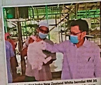
Arnab pedaging baka New Zealand White bernilai RM 35 sekilogram yang hidup dengan berat sekitar sekilogram hingga 1.6 kilogram setiap ekor.